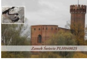
Zamek Świecie PL11040025