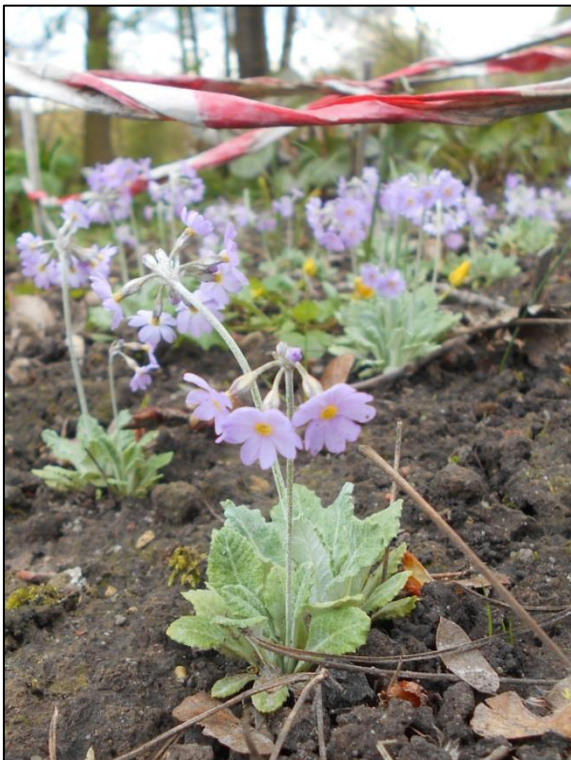
Fot. 7. Primula farinosa w Ogrodzie Botanicznym UMCS w Lublinie

Ogród Botaniczny Uniwersytetu Warszawskiego: według Index Plantarum wprowadzony w 2007 z OB Uniwersytetu Jagiellońskiego w Krakowie ( http://www.ogrod.uw.edu.pl ).