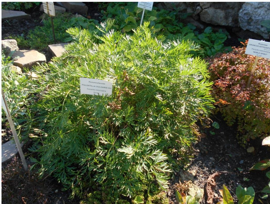
Fot. 16. Pulsatilla vulgaris w Ogrodzie Botanicznym Uniwersytetu Jagiellońskiego

Ogród Botaniczny Uniwersytetu im. M. Curie-Skłodowskiej w Lublinie: w 2017 w uprawie, wprowadzony w 1966 lub 1969 z Miasteczka UMCS w Lublinie ("Stary Botanik") - pochodzenie pierwotne niewiadome, obecnie 20 sztuk; uprawa średnio trudna, korzenie zjadane przez gryzonie, w warunkach uprawy krzyżuje się z innymi gatunkami (inf. niepubl. uzyskane z ogrodu, 2017).