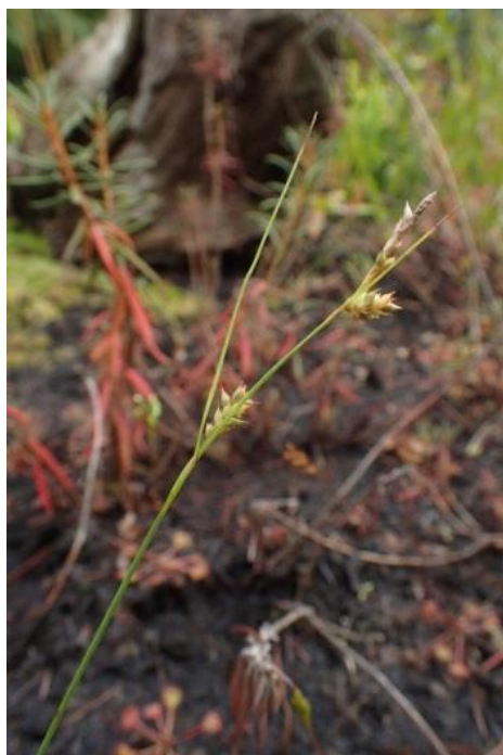
Fot. 13. Carex punctata w Ogrodzie Botanicznym Uniwersytetu Wrocławskiego

Ogród Botaniczny Uniwersytetu Wrocławskiego: pojedyncze okazy w uprawie (obs. własne z ogrodu, 2017).